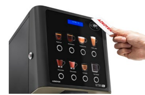
Kit RFID-Lesegerät Für Produktladekarten oder bargeldlose Systeme.