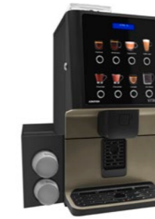
Kit Bechermodule Zum Spenden von Bechern.