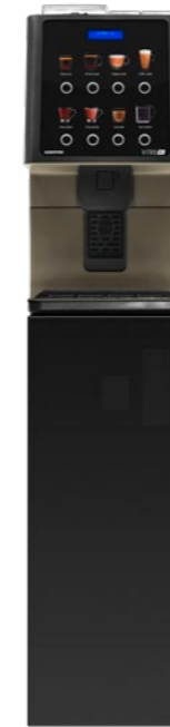
Kit Sockel Vorbereitet für Münzprüfer. (850 mm.)

Auch für den Kaffeeservice in Lebensmittelgeschäften ist sie die perfekte Lösung und für Hotels, in denen das Frühstück gut, aber ebenso schnell sein sollte, bietet die Maschine ein angenehmes Erlebnis, mit einem attraktiven Design, einfach und funktional.