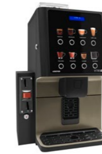
Kit Validierungsmodul Vorbereitet zur Installation eines Münzprüfers.